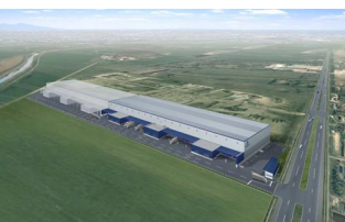
ロジポート北海道